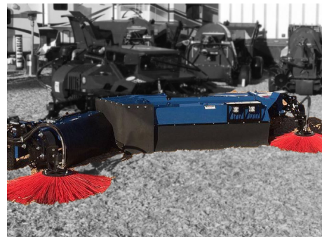
Cabezal de hileradora power-v