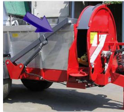
Puerta hidráulica delantera