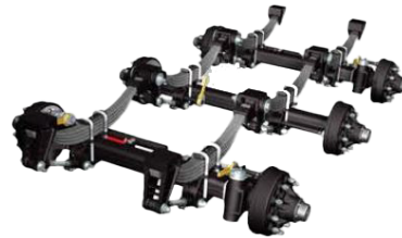
Tridem con suspensión de 1º y 3º ejes automáticos y bloqueo hidráulico