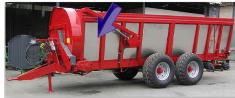
Aros y fondo en acero inoxidable 309