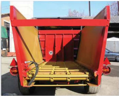
Lado trasero móvil con avance automático, accionado por cadenas para productos semi-densos