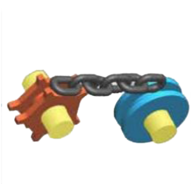
Cadenas navales 16mm de diámetro