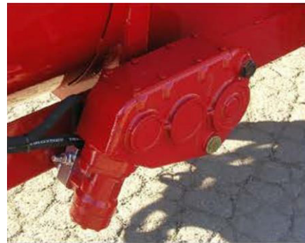
Válvula anti-choque y alimentación por correa hidráulica de velocidad ajustable