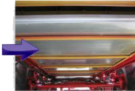
Doble fondo de la lámina galvanizada bajo las cadenas