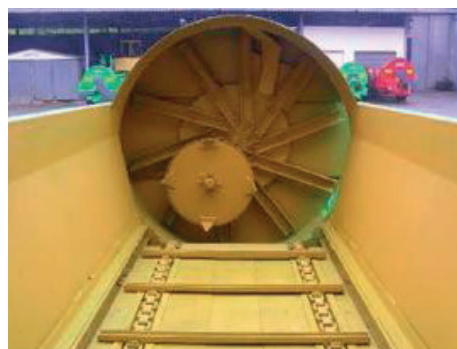
Esparcidor con rotor de corte y cuchilla raspadora