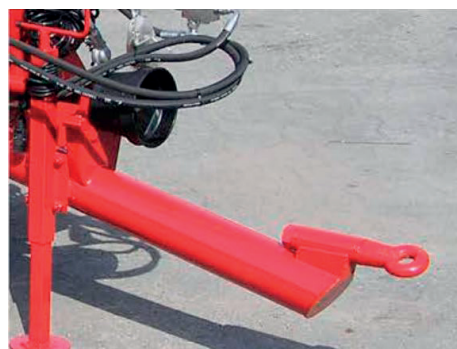
Timón fijo con ojo