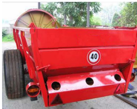
Kit de luces