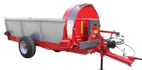
Galvanizado por inmersión en caliente de los lados laterales y traseros