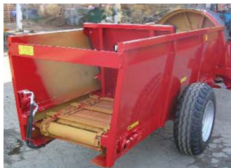
Lado trasero móvil con alimentación automática, accionado por cadenas