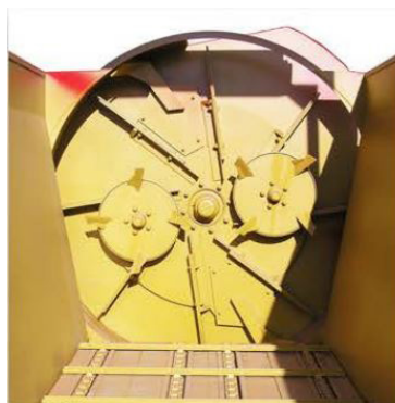
Turbina profesional doble triturador y doble cuchilla de acero para producto muy compactos o con mucha paja