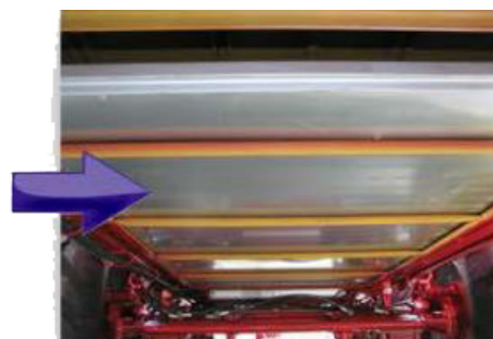
Doble fondo de la lámina galvanizada bajo las cadenas