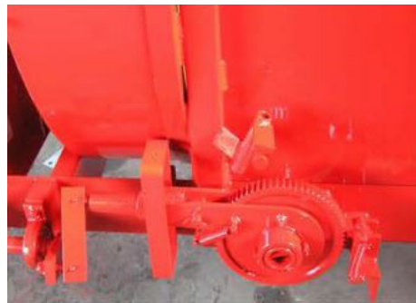
Transportador de cadenas mecánico con 3 velocidades