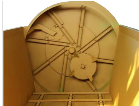
Turbina con cuchilla picadora y raspadora