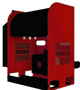
Central hidráulica incluida VM150