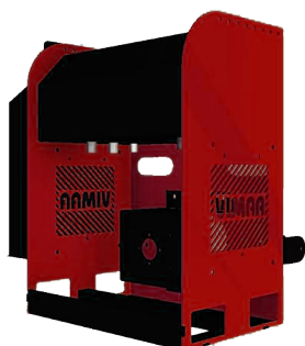
Central hidráulica incluida VM150