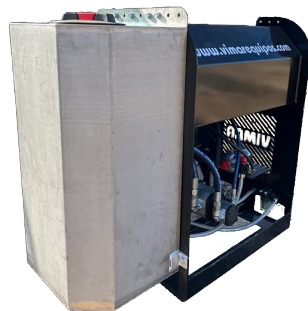
Depósito INOX bomba

Prepodadora doble para montar en pala del tractor, retroexcavadoras y cargadoras telescópicas, con discos especiales para trabajos de corte de ramas hasta Ø8 cm, según el disco montado.