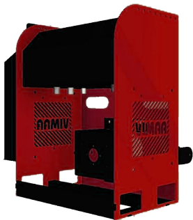
Central hidráulica incluida VM150