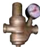
Válvula reductora de presión con manómetro