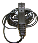
Kit hidráulico para 3 movimientos