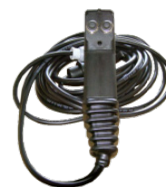
Kit hidráulico para 3 movimientos