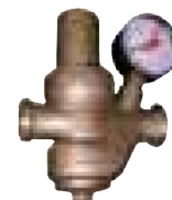
Válvula reductora de presión con manómetro