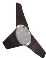
Discos de cuchillas para rama fina verde con sistema de aspiración (corte máx. 15 mm)

La barra de discos es una barra profesional para el corte forestal.