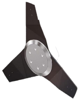
Discos de cuchillas para rama fina verde con sistema de aspiración (corte máx. 15 mm)

La barra de discos es una barra profesional para el corte forestal.