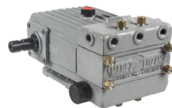
Bomba especial directa ML-D