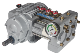
Bomba super reductora ML-A1 (Equipamiento de serie)