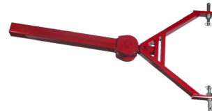
Lanza articulada a los brazos del tractor