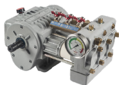
Bomba super directa ML-A