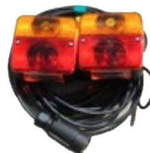
Kit de luces