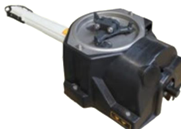
Grupo de distribución