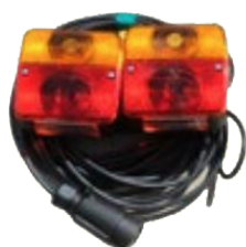
Kit de luces