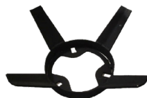
Agitador de cal