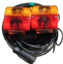
Kit de luces