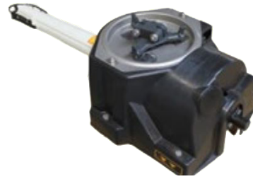
Grupo de distribución