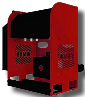
Central hidráulica incluida