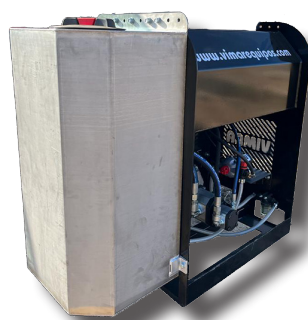
Depósito INOX bomba VM150

Las imágenes y las características técnicas son meramente indicativas y no vinculantes. Cualquier modificación de tipo técnico o comercial se realizará sin obligación alguna de aviso previo.