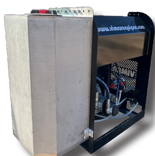
Depósito INOX bomba