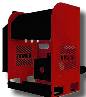
Central hidráulica incluida VM150