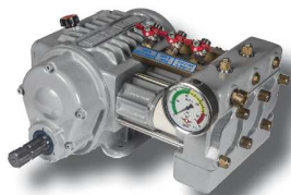
Bomba super reductora ML-A1 (Equipamiento de serie)