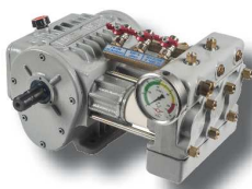
Bomba super directa ML-A